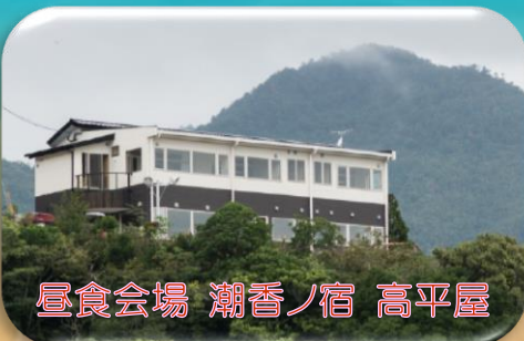
昼食会場 潮香ノ宿 高平屋