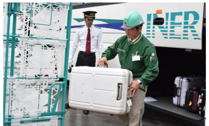
デモンストラーションの様子