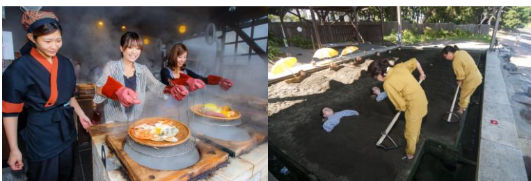
温泉地として賑わう別府市

大分航空ターミナルは、増加する訪日外国人に対応するため、今年度、国際線ターミナルビルの増改築を行います。荷受カウンター隣りには観光案内所を常設し、多言語に対応したサービスを提供できるスタッフを配置しています。