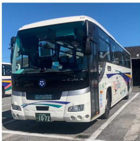
大分交通株式会社

本サービスにおきまして、クレディセゾンはタッチ決済の導入の支援を行い、インバウンド観光客を含む国内移動における利便性の向上に努めてまいります。