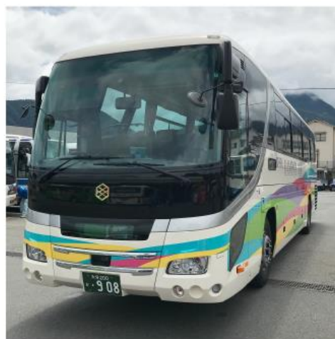
亀の井バス株式会社