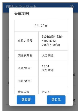
乗車明細・領収書発行画面